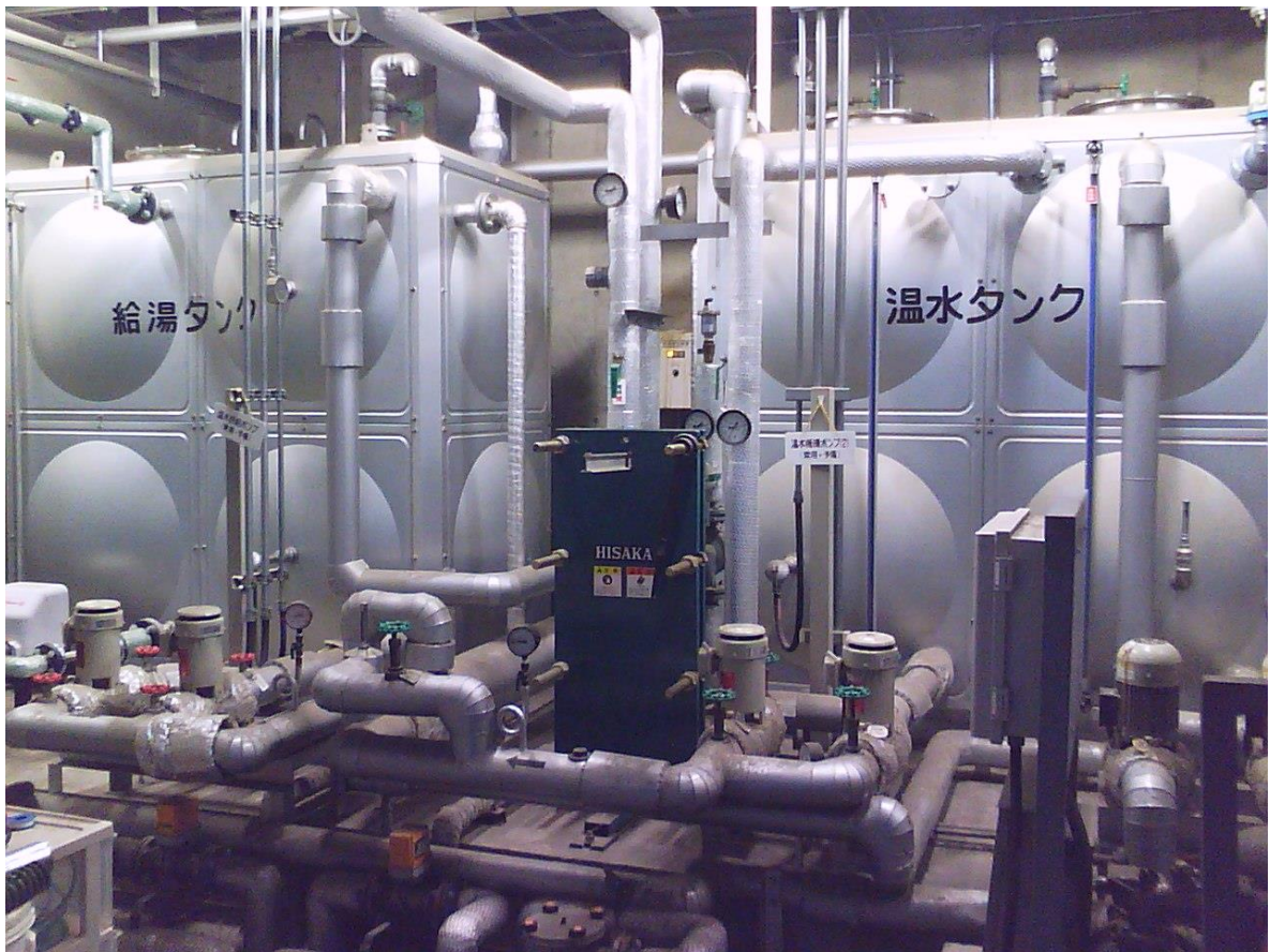
④ 温水タンク ・ ⑤ 給油タンク