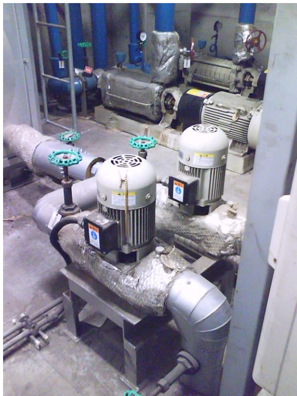
⑥ 温水循環ポンプ (1)