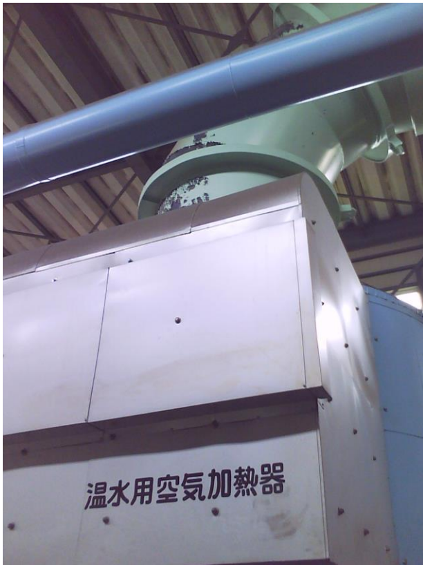
② 温水用空気加熱器