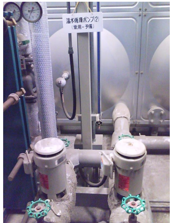
⑦ 温水循環ポンプ (2)